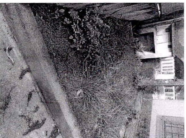
Entrada da biblioteca