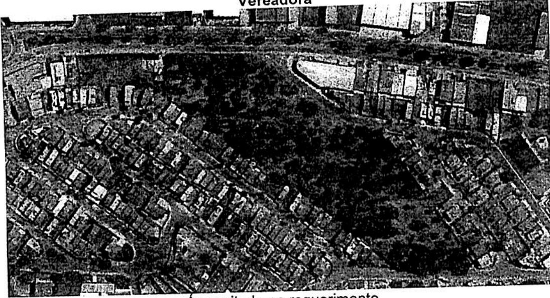
Área citada no requerimento