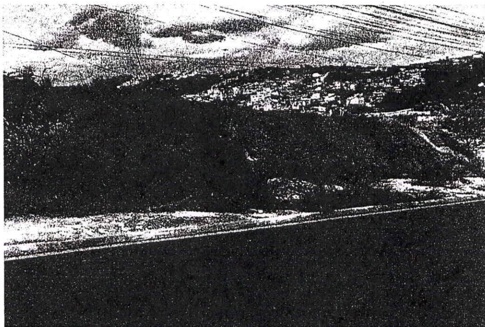
Entulho Rua das Gerberas