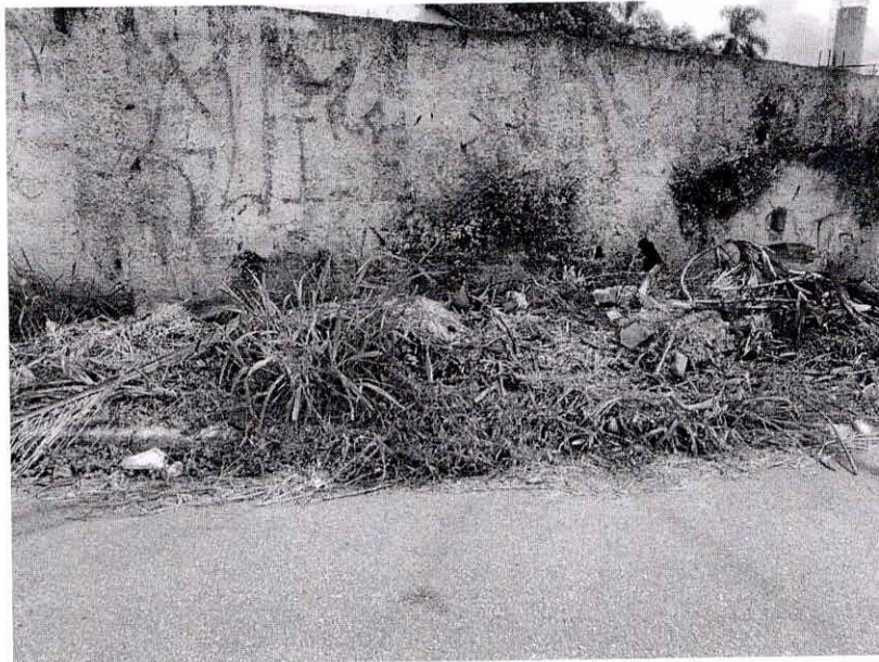
Esquina entre Avenida Bento da Silva Bueno e Rua Cordeiropolis